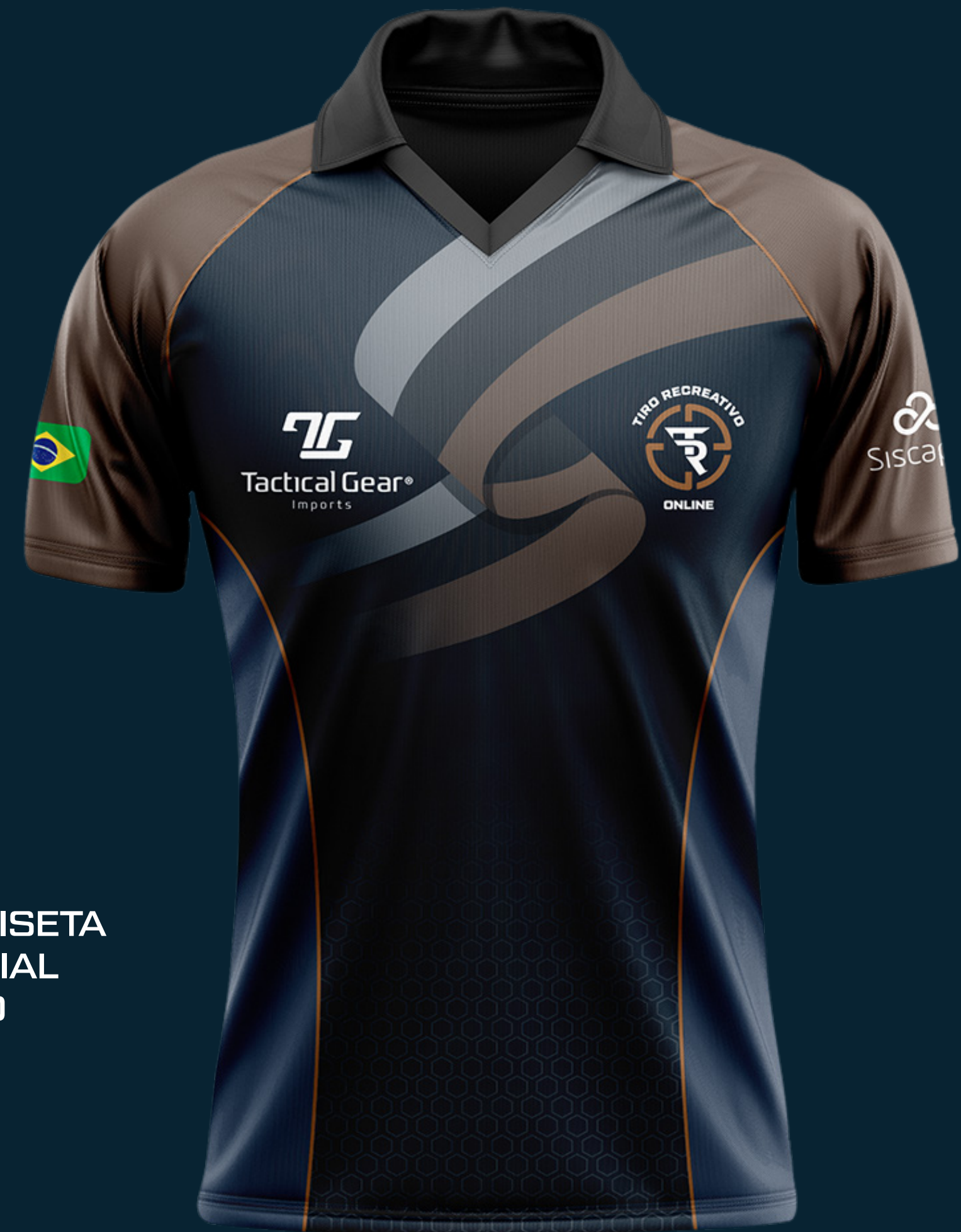
CAMISETA OFICIAL T.R.O

O Torneio Interclubes on-Line é composto de 6 etapas com 2 descartes , a sexta e última etapa em peso 2 , considerando assim os 5 melhores resultados .